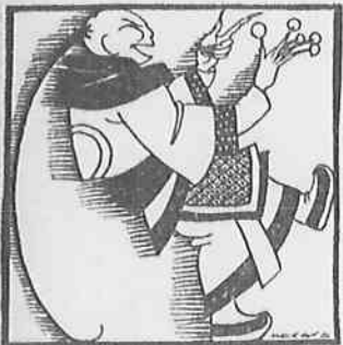
LOS RACIMOS DE ORO DEL MIKADO TITCHIN (9 m.)